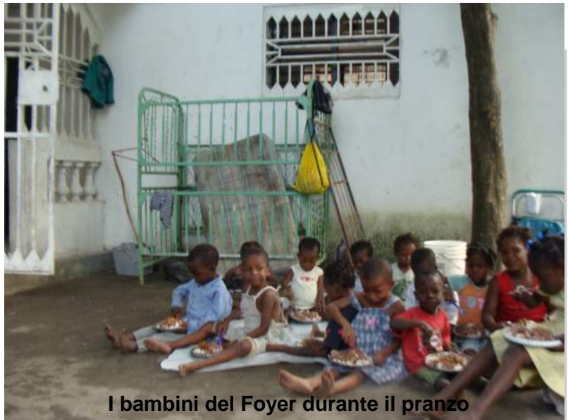
I bambini del Foyer durante il pranzo

Dal punto di vista energetico la struttura si auto sosterrà grazie all'installazione di pannelli fotovoltaici.